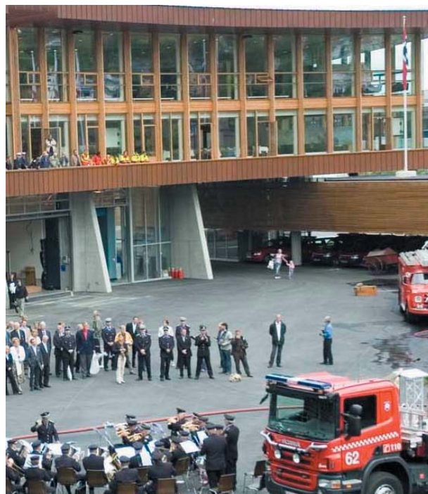
Bergen hovedbrannstasjon Arkitekt Stein Halvorsen AS